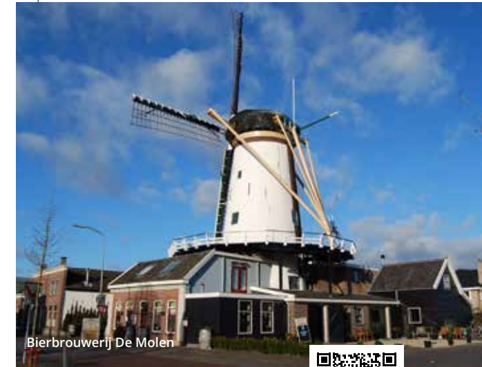
Bierbrouwerij De Molen

Een meerdaagse vaarroute rondom de gemeentes Kaag en Braassem, Alphen aan den Rijn en Leiden. De route gaat onder meer over de Leidse Vaart, die uitkijkt over de Langeraarse Plassen. De zonsondergang in Rijnsaterwoude bij Haven 't Venegat is elke avond spectaculair. Onderweg passeer je onder andere de Googermolen. Korenmolen de Eendracht, de Kagermolen en Vrouw Vennemolen. Ook vaar je langs het Zegerplasgebied, met diverse strandjes en horeca aan het water. Via het Alphen-se centrum en bierbrouwerij De Molen in Bodegraven, gaat de route terug via de Kagerplassen en Kaageiland.