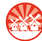
Kinderdijk & Molens